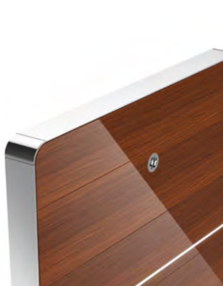
Holzlaminat / replica

Umlaufend werden diese Platten geschützt von einem Aluminiumprofil, das einen stabilen Kantenschutz bildet. Dieses Profil wird alternativ passend zum Fuß in poliert oder eloxiert angeboten.