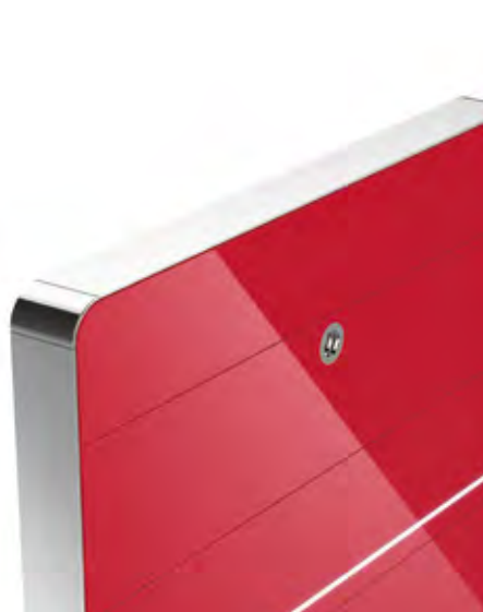
rot / red