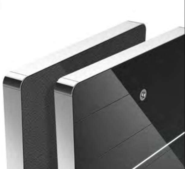
leder faserstoff / bonded leather - schwarz / black