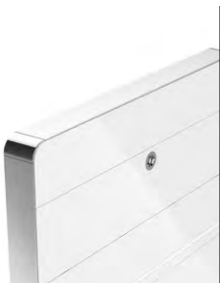
weiss / white