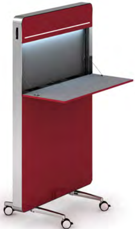
nomado standing position

nomado ist in unterschiedlichen Höhen und Ausführungen erhältlich: Als reine Akustikwand ohne Ausfaltungsfunktion ( nomado-panel ), mit Ausfaltungplatte in Stehhöhe 110 cm ( nomado-standing position ), mit Ausfaltungplatte in Sitzhöhe 74,5 cm und zusätzlicher Regalfläche ( nomado-standard )